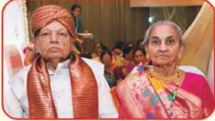
માતુશ્રી ડાઈબેન ભારમલ મોમાયા ગાલા